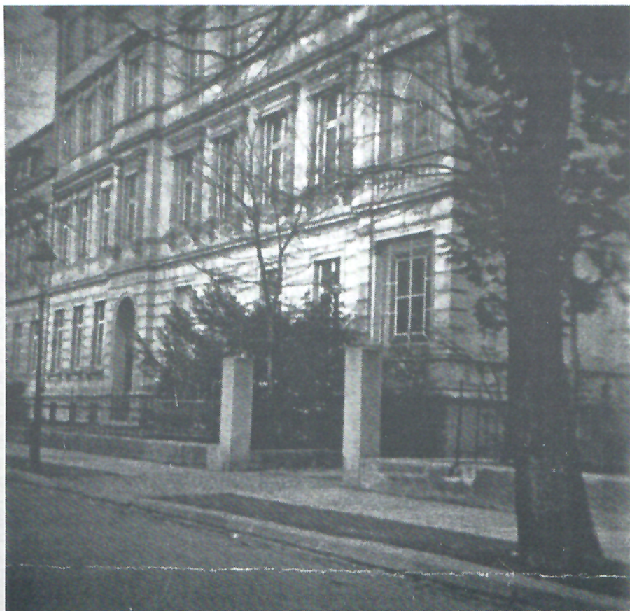
Die Häuser Augustastraße 8 und 10, Domizil verschiedener Schulen. Zustand ca. 1950.