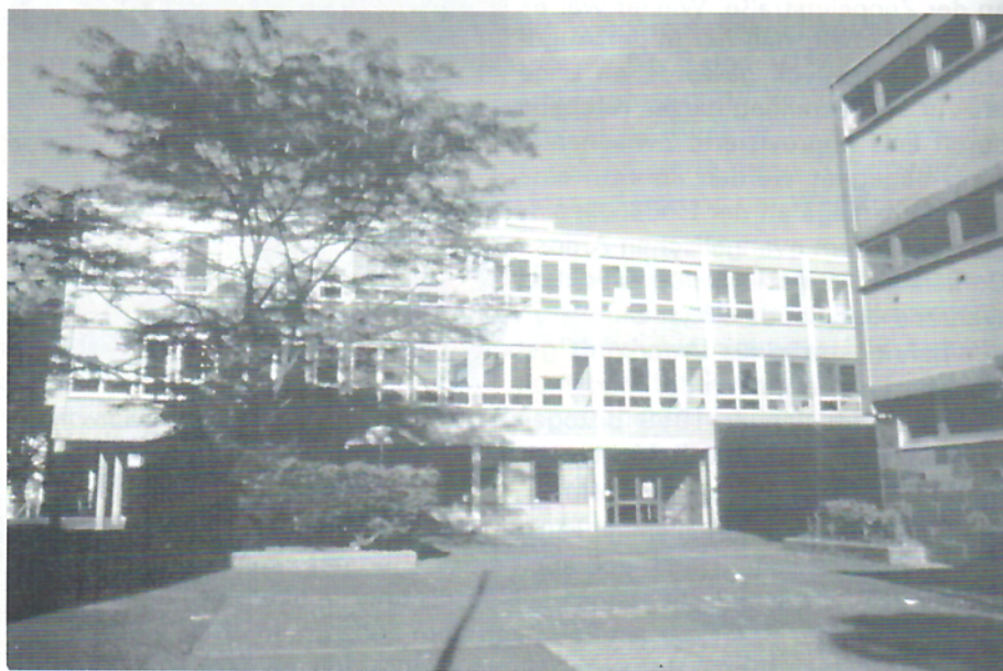
Der Neubau der "Carl-Schurz-Realschule" an der Augustastraße, jetzt Berufsschule.

Arbeiten endlich abgeschlossen und die Schule konnte ihren Einzug halten. Sie hatte auch einen neuen Namen erhalten: auf Empfehlung des Schulausschusses vom 12. April 1965, der dem Antrag des Lehrerkollegiums entsprach, erhielt sie nach Beschluß der Stadtvertretung vom 27. April 1965 den Namen "Carl-Schurz-Schule, Realschule für Jungen" in Erinnerung an den Deutsch-Amerikaner Carl Schurz, der als Demokrat von 1848 aus unserem Raum stammend, Hervorragendes beim Aufbau der Vereinigten Staaten leistete und unserer Jugend ein Vorbild demokratischer Gesinnung sein soll.